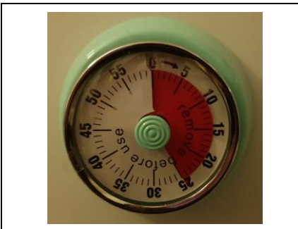
20-25 Minuten backen bei 190 Grad