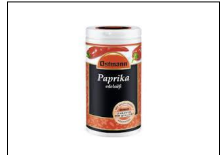
1 TL Paprikapulver