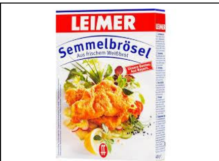
8 EL Semmelbrösel