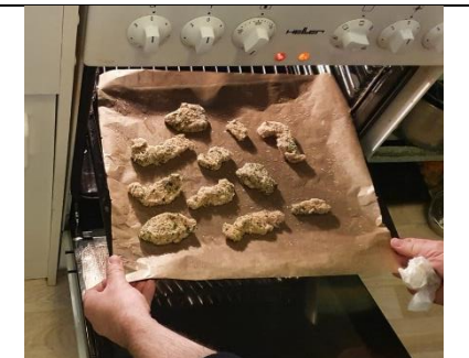
Backblech in den Ofen schieben