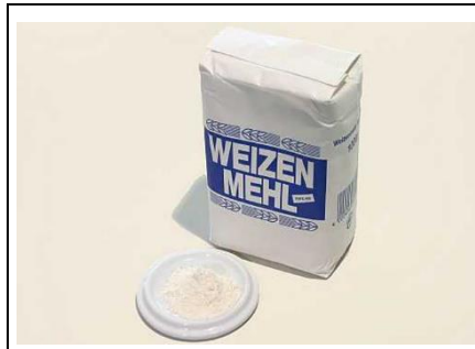
5 EL Mehl