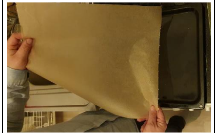
Backpapier auf ein Backblech legen