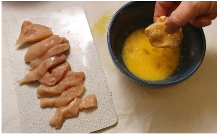
Hähnchen danach in Ei wenden