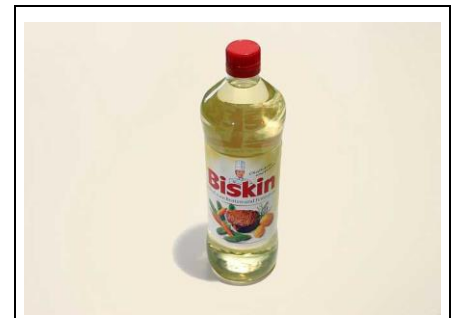
2 EL Öl