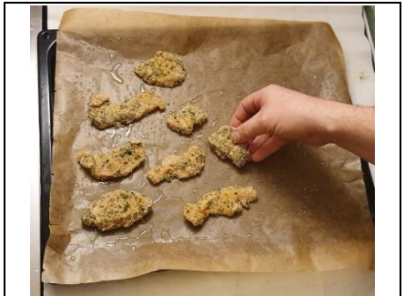
Hähnchen auf das Backpapier legen