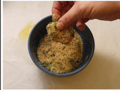
Hähnchen zuletzt in Semmelbrösel wenden