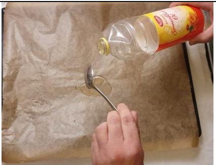
2 EL ÖL auf das Backpapier geben