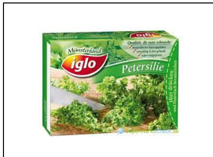
1 EL Petersilie